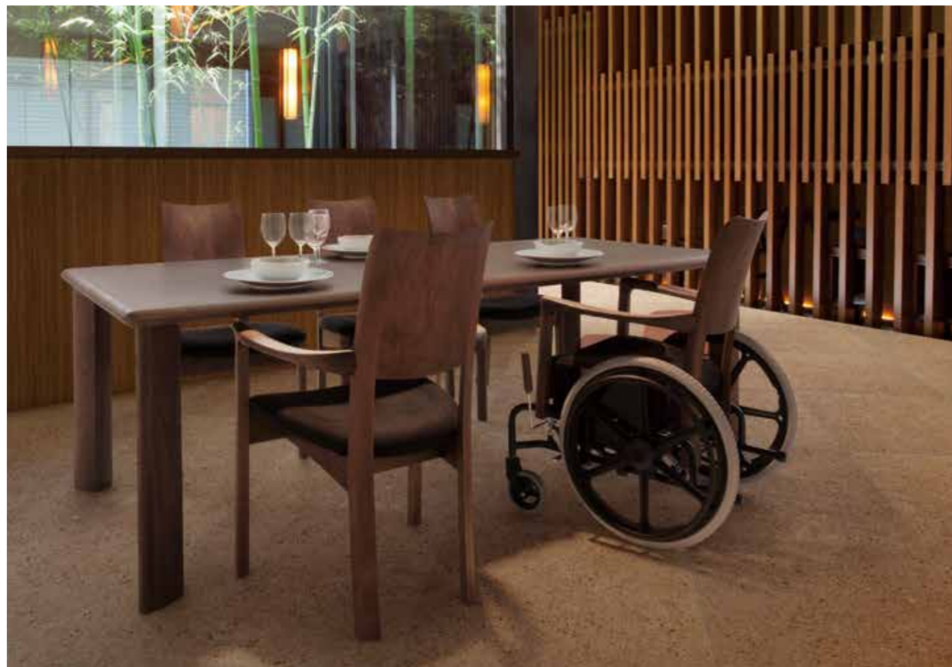
介護用ハンドルはオプションになります。